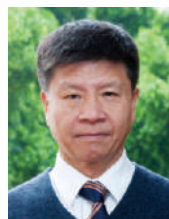
孙世刚 院士 厦门大学