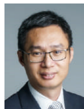
陈晓东 教授 新加坡南洋理工大学