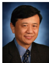
孙学良 院士 加拿大西安大略大学