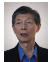
陈立泉 院士 中国科学院物理研究所